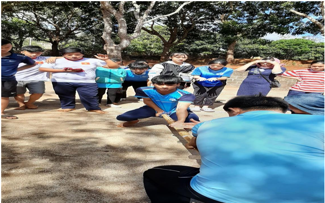
Hình 6: Giao lưu đẩy gậy với trường bạn