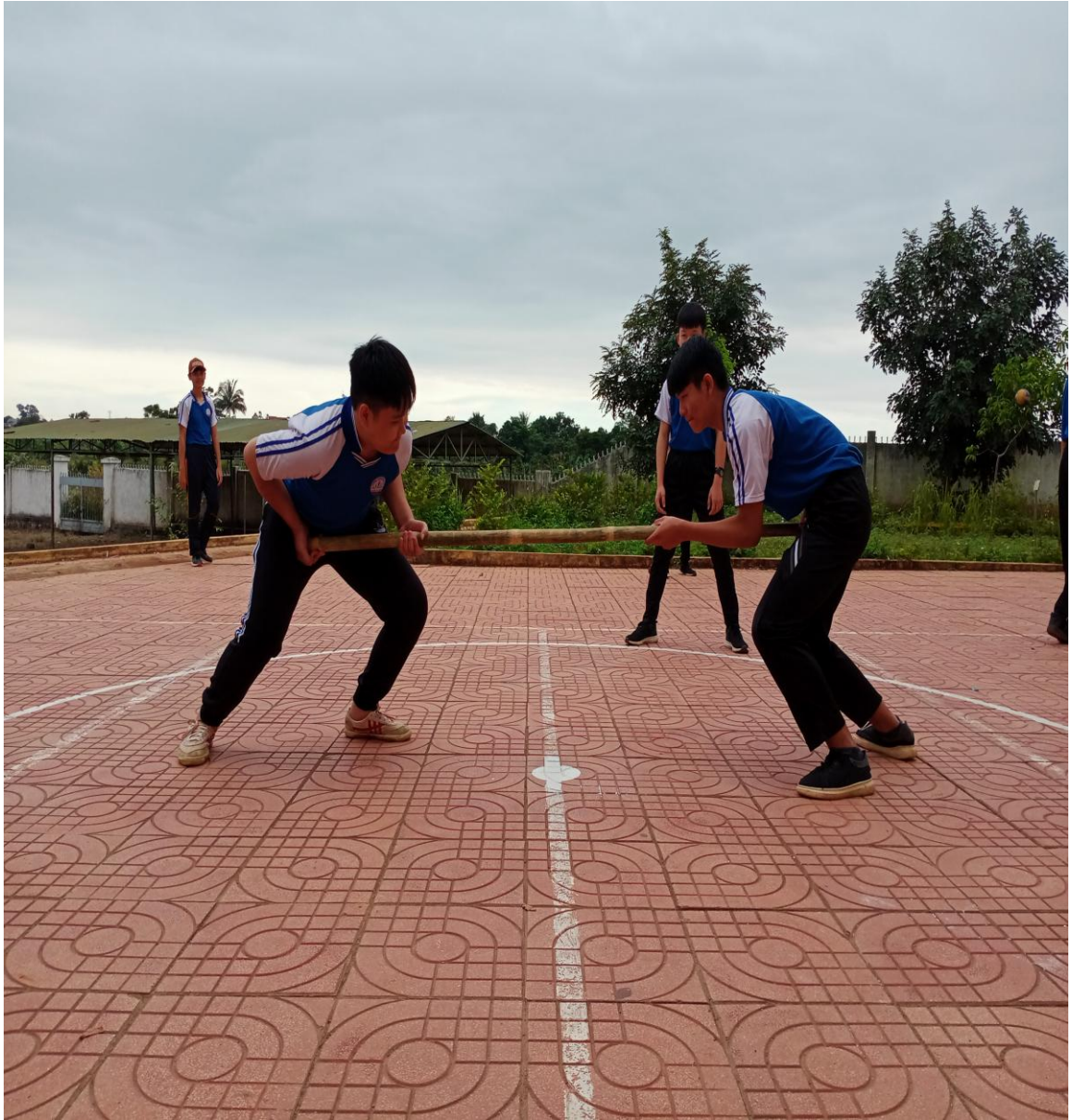
Hình 5: Học sinh tập luyện