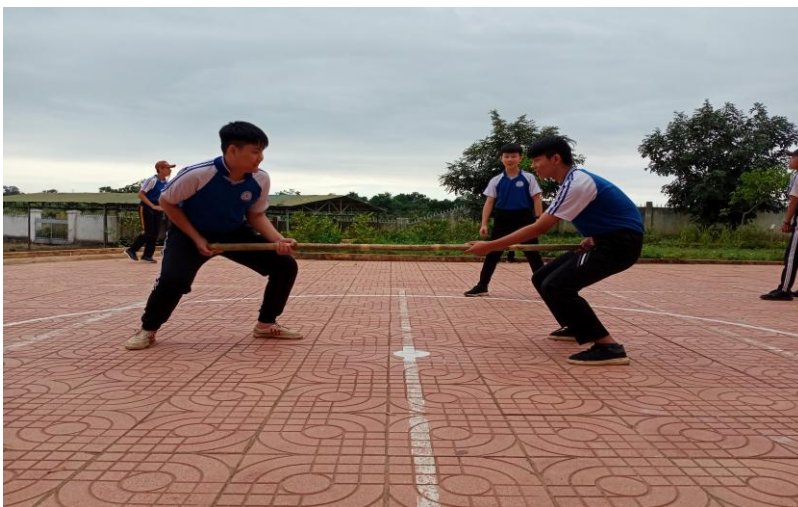
Hình 5: Học sinh tập luyện