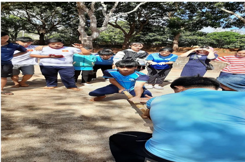
Hình 6: Giao lưu đẩy gậy với trường bạn